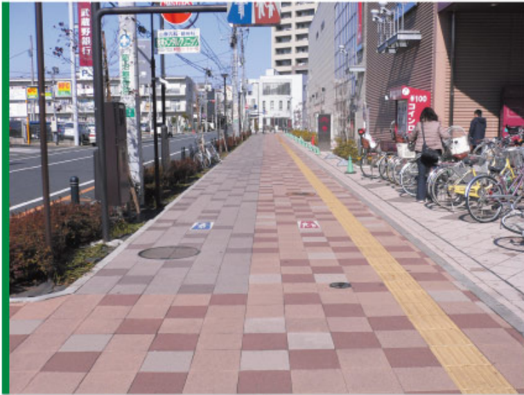
KY-336タイプ ● +ダイセラサイン