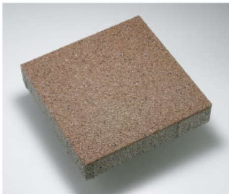
KY-336-25 (ブラウン) ※200×100×60シリーズ同様、色7色あります。