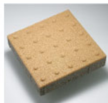
KY-336-P (点字ブロック歩行用)