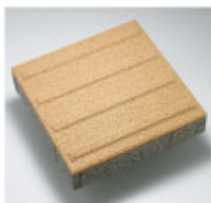
KY-336-L (線字ブロック歩行用)